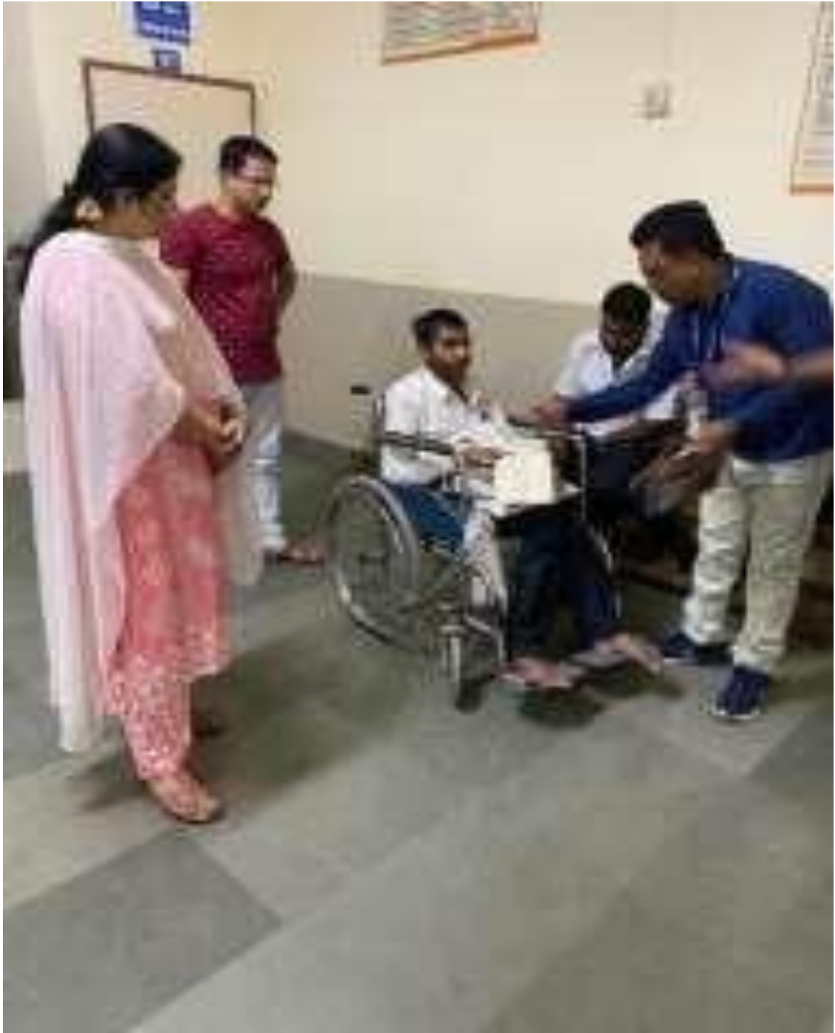
Human assistance offered by office staff to the differently abled persons