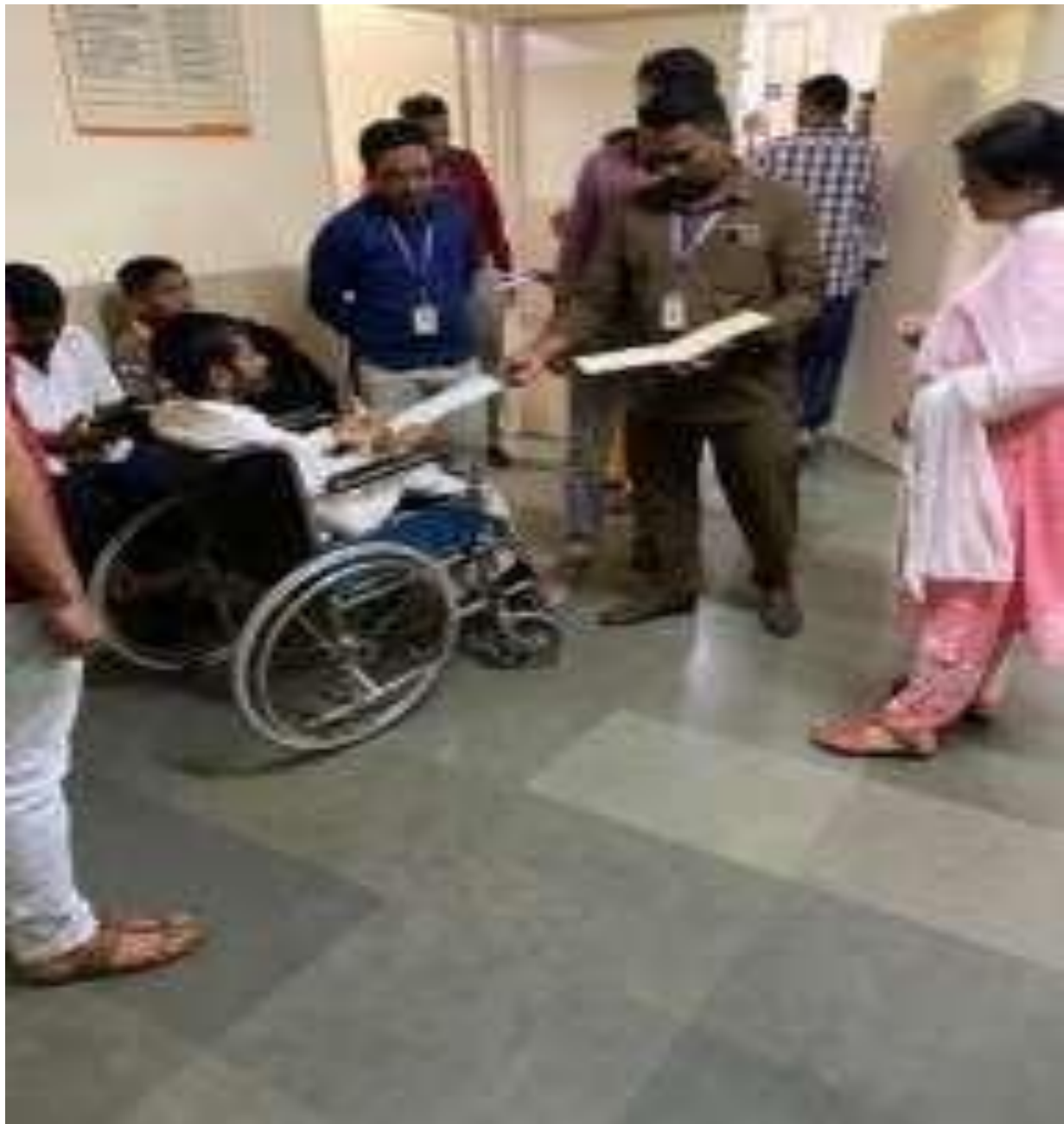
Human assistance offered by office staff to the differently abled persons